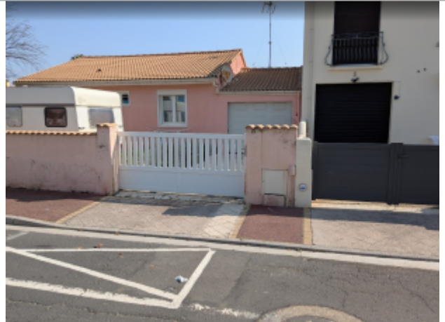
rue des vendanges