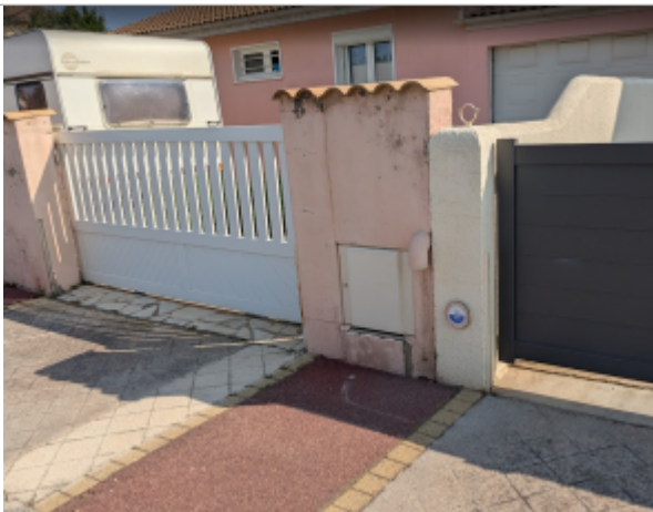
rue des vendanges