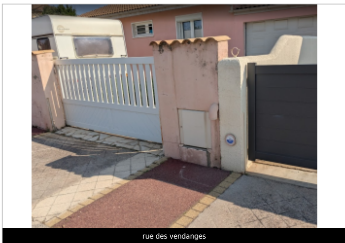
rue des vendanges

Maximum de l'inondation : Oui Visibilité : Oui État du repère : Bon Pérennité : Longue