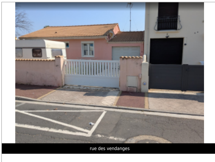
rue des vendanges