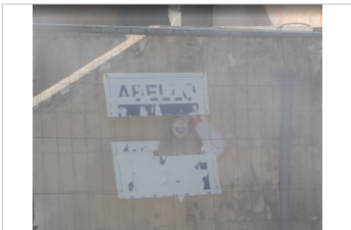
gradin sade serignan

Maximum de l'inondation : Oui Visibilité : Oui État du repère : Bon Pérennité : Longue