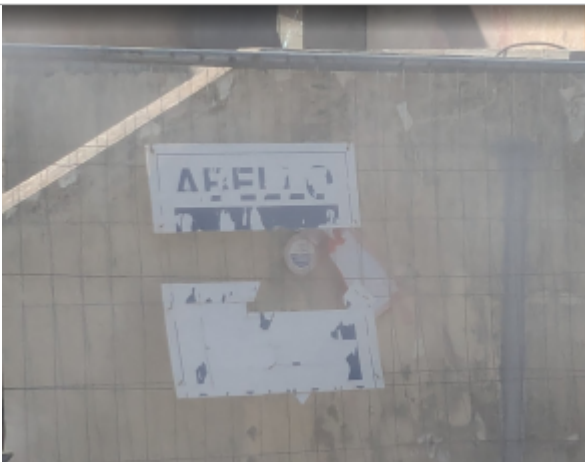
gradin sade serignan

Altitude calculée de l'eau (en m) : 4.38