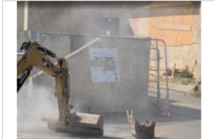
gradins stade serignan