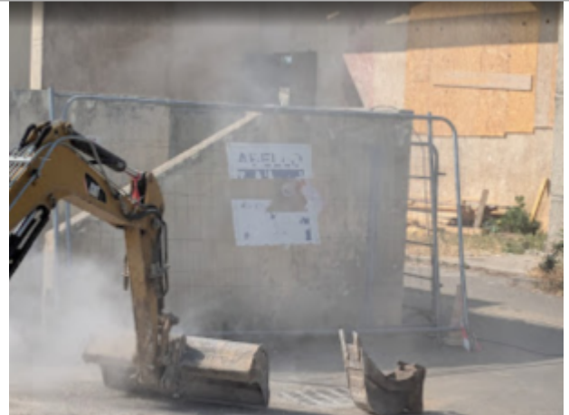
gradins stade serignan

Coordonnées WGS84 : X: 3.27628115 / Y: 43.27879220