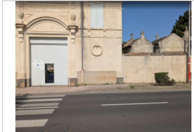
entree cimetière sérignan

Coordonnées WGS84 : X: 3.28365919 / Y: 43.27764240