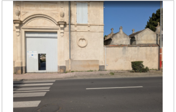
entree cimetière sérignan