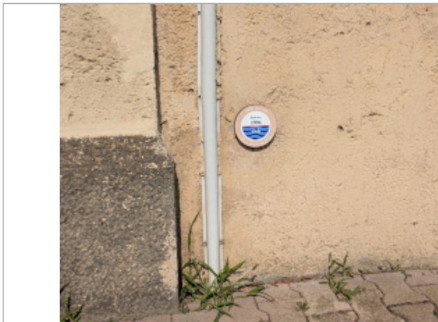
entree cimetiere serignan