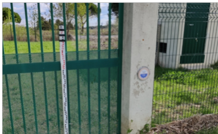
pilier station pompage