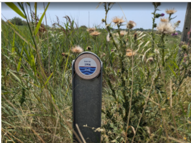
carrefour proche Cassafières