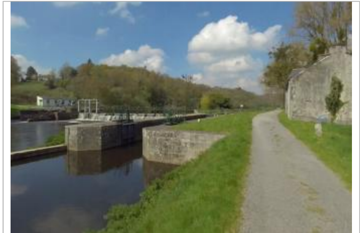
Ecluse de Moulin Neuf aval à Pluméliau-Bieuzy