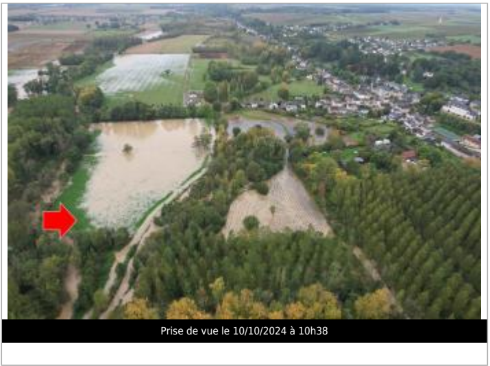
Prise de vue le 10/10/2024 à 10h38