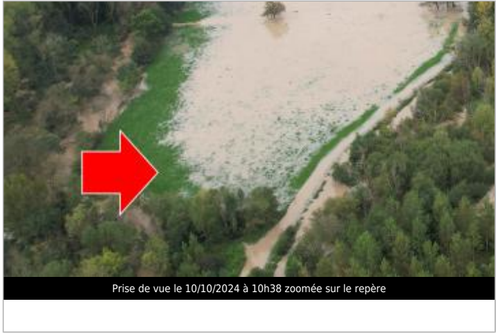
Prise de vue le 10/10/2024 à 10h38 zoomée sur le repère