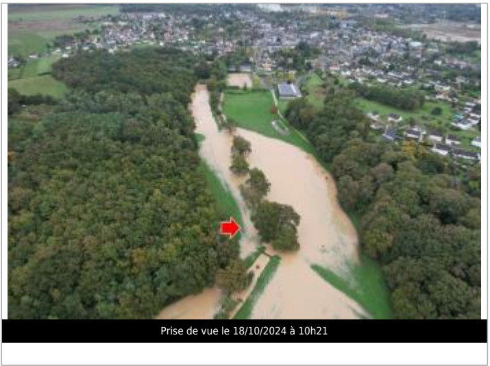
Prise de vue le 18/10/2024 à 10h21