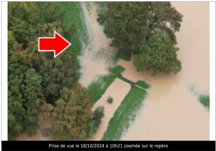
Prise de vue le 18/10/2024 à 10h21 zoomée sur le repère