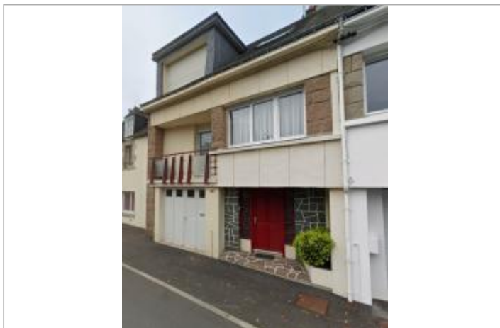
Maison au 18 rue de la Fontaine à Pontivy