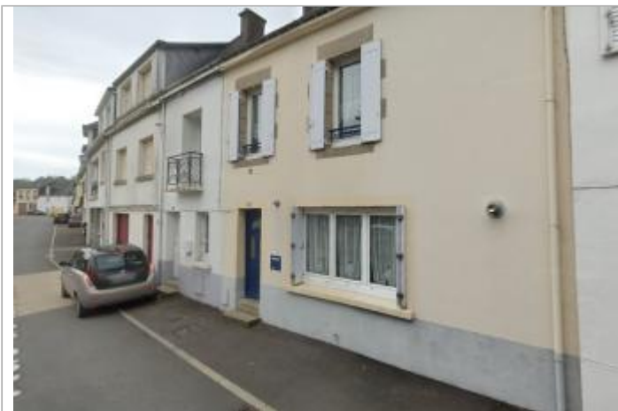
Maison au 8 rue de la Fontaine à Pontivy