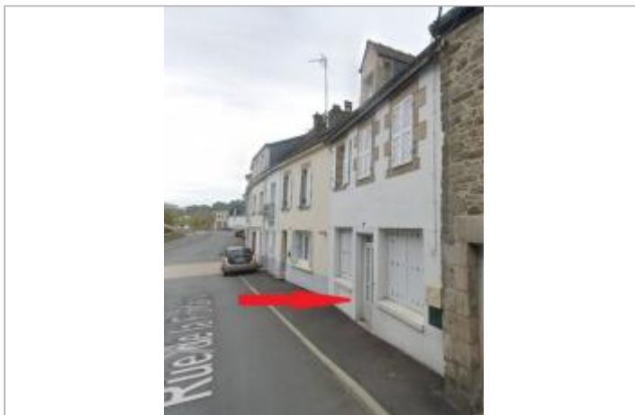
Maison au 6 rue de la Fontaine