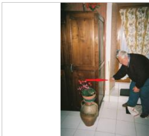
Laisse de crue à l'intérieur de la salle à manger