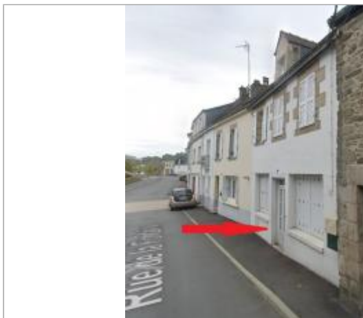
Maison au 6 rue de la Fontaine

Coordonnées WGS84 : X: -2.96895720 / Y: 48.06894040