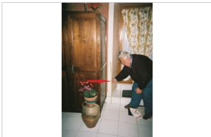
Laisse de crue à l'intérieur de la salle à manger

Différence entre le niveau d'eau et la référence (en m) : 0.550 m