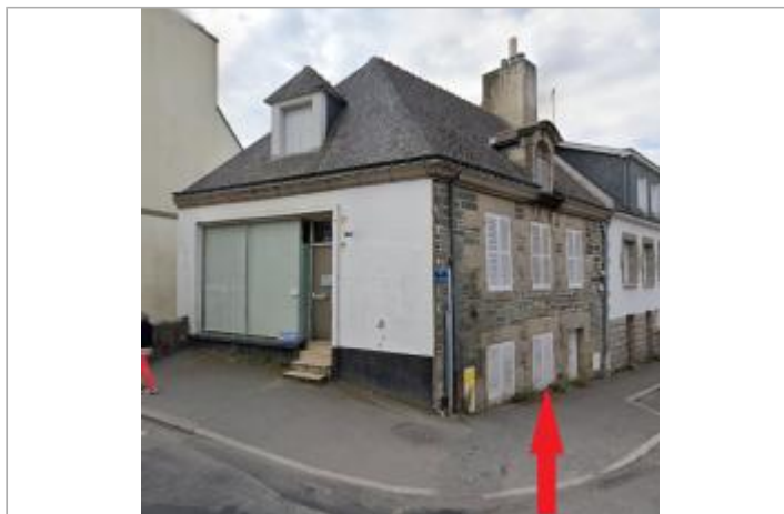
Maison au 9 rue du Général Quinivet