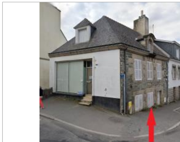
Maison au 9 rue du Général Quinivet

Coordonnées WGS84 : X: -2.96869683 / Y: 48.06902440