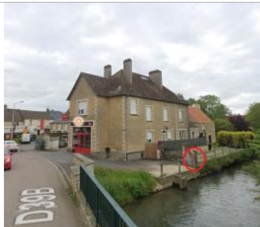
Vue depuis le pont