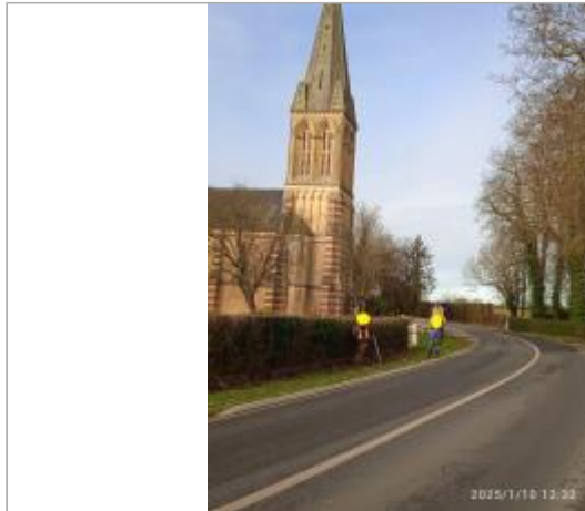
Haie bordure de RD49 à gauche de l'église en arrivant de la Mairie de Victot-Pontfol

Coordonnées WGS84 : X: -0.01774955 / Y: 49.16506890