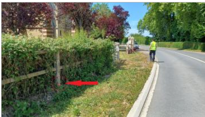
Laisse de crue au pied de la haie.