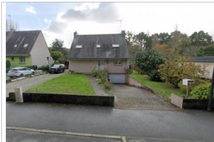
Maison au 26 rue du Blavet à Inzinzac-Lochrist