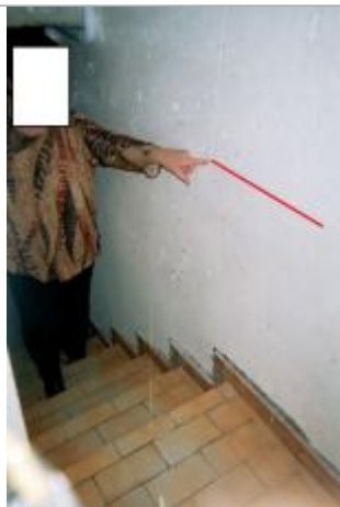
Niveau de l'inondation dans le sous-sol de la maison

Altitude calculée de l'eau (en m) : 9.99