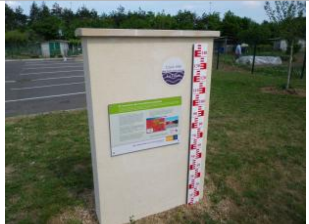
Vue du site en 2011, source : département du Loiret.