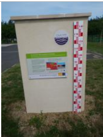
Vue du repère en 2011, source : département du Loiret.

Organisme : Conseil Départemental du Loiret SPC Loire-Allier-Cher-Indre