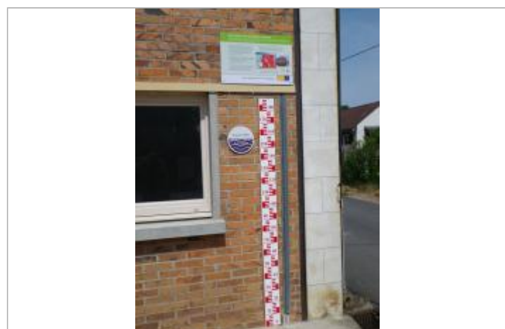
Vue du repère en 2011, source : département du Loiret.

GÉNÉRAL Code : 25LACID45_R_10_1 Date de mise à jour : 27/05/2025 Auteur : SPC LACI