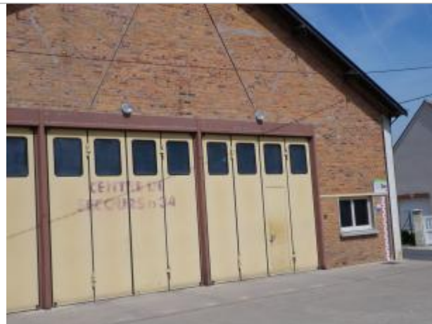
Vue du site en 2011, source : département du Loiret.