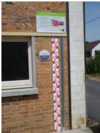
Vue du repère en 2011.

Organisme : Conseil Départemental du Loiret SPC Loire-Allier-Cher-Indre