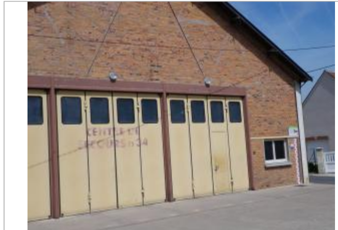
Vue du site en 2011, source : département du Loiret.