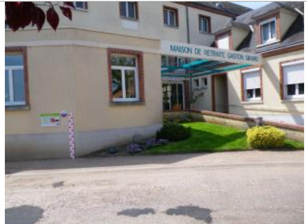
Vue du site en 2011, source : département du Loiret.

Coordonnées WGS84 : X: 2.30642300 / Y: 47.81249600