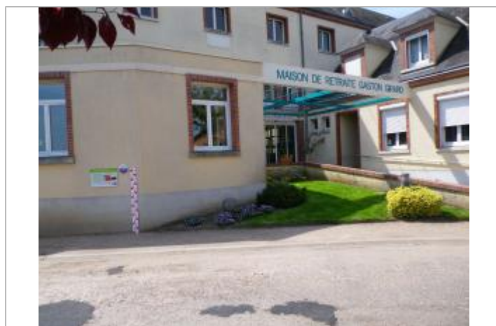
Vue du site en 2011.

GÉOLOCALISATION Coordonnées WGS84 : X: 2.30642300 / Y: 47.81249600 Coordonnées RGF93 (Lambert 93) : X: 648090.98 / Y: 6746017.02 Coordonnées RGF93 (ETRS89) : X: 2.306423 / Y: 47.812496 Code Hydro: ----0000 Rive de référence: Droite