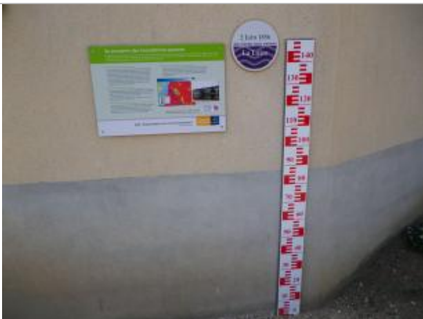
Vue du repère en 2011, source : département du Loiret.

Organisme : Conseil Départemental du Loiret SPC Loire-Allier-Cher-Indre