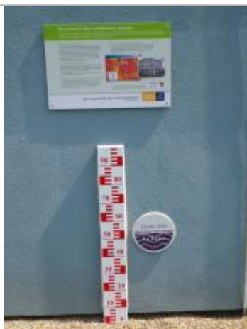
Vue du repère en 2011, source : département du Loiret.

Organisme(s) : Conseil Départemental du Loiret, SPC Loire-Allier-Cher-Indre