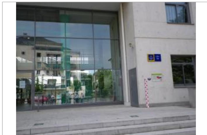
Vue du site en 2011

GÉOLOCALISATION Coordonnées WGS84 : X: 1.90672400 / Y: 47.88393100 Coordonnées RGF93 (Lambert 93) X: 618287.97 / Y: 6754292 Coordonnées RGF93 (ETRS89) : X: 1.906724 / Y: 47.883931 Code Hydro: ----0000 Rive de référence: Gauche