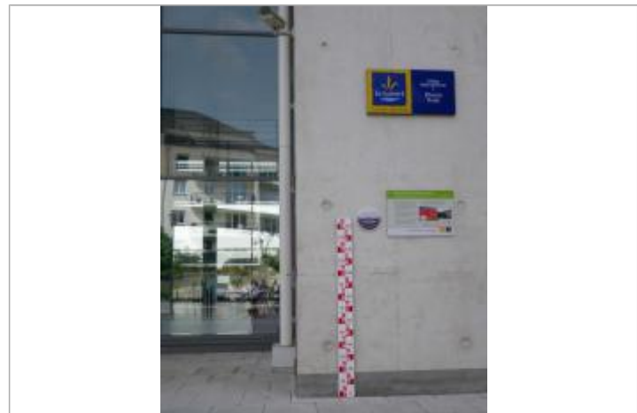
Vue du repère en 2011, source : département du Loiret.

MARQUE Texte : 2 juin 1856 - plus hautes eaux connues - La Loire Maximum de l'inondation : Oui Visibilité : Oui État du repère : Bon Pérennité : Longue Repère calculé : Non renseigné PHEC : Oui