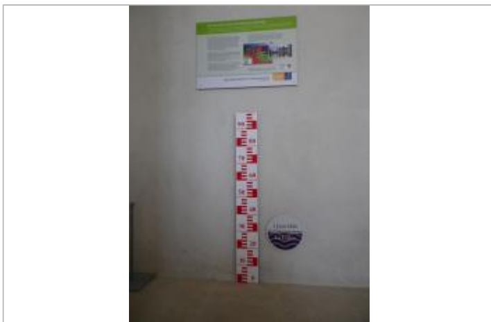
Vue du repère en 2011, source : département du Loiret.

Organisme : Conseil Départemental du Loiret SPC Loire-Allier-Cher-Indre