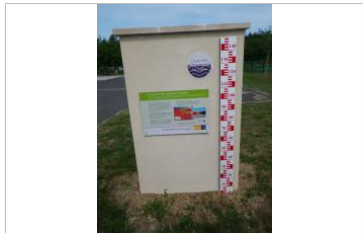
Vue du repère en 2011, source : département du Loiret.

MARQUE Texte : 2 juin 1856 - plus hautes eaux connues - La Loire Maximum de l'inondation : Oui Visibilité : Oui État du repère : Bon Pérennité : Longue Repère calculé : Non renseigné PHEC : Oui