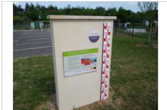
Vue du site en 2011, source : département du Loiret.

GÉOLOCALISATION Coordonnées WGS84 : X: 1.92341500 / Y: 47.88700100 Coordonnées RGF93 (Lambert 93) X: 619540.03 / Y: 6754615.95 Coordonnées RGF93 (ETRS89) X: 1.923415 / Y: 47.887001 Code Hydro: ----0000 Rive de référence: Gauche