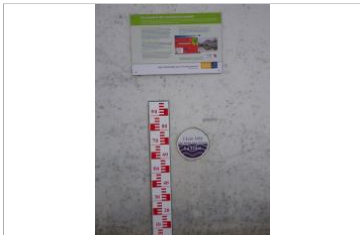
Vue du repère en 2011.

Organisme(s) : Conseil Départemental du Loiret, SPC Loire-Allier-Cher-Indre