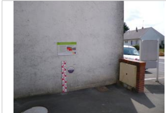
Vue du site en 2011, source : département du Loiret.