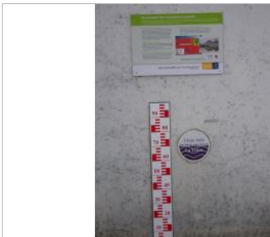
Vue du repère en 2011, source : département du Loiret.

Organisme : Conseil Départemental du Loiret SPC Loire-Allier-Cher-Indre