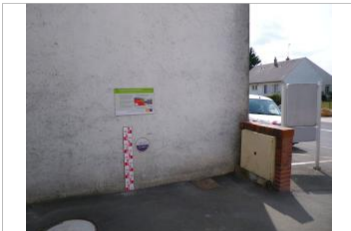
Vue du site en 2011, source : département du Loiret.