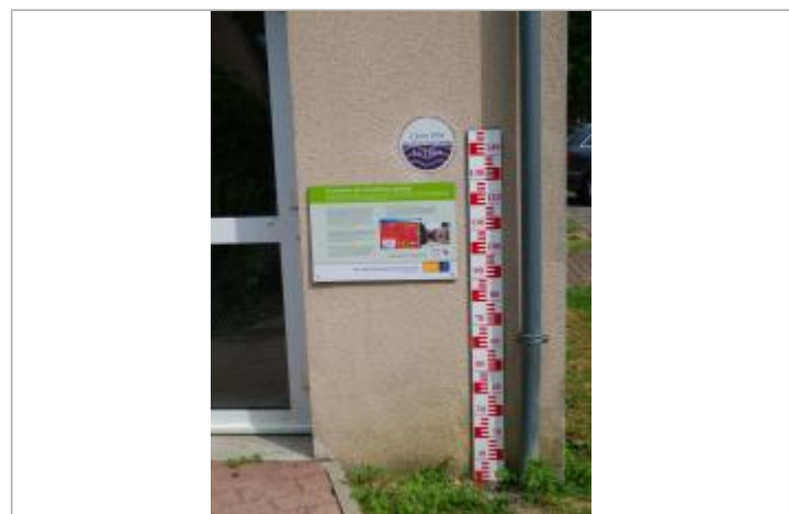
Vue du repère en 2011, source : département du Loiret.

GÉNÉRAL Code : 25LACID45_R_9_1 Date de mise à jour : 27/05/2025 Auteur : SPC LACI