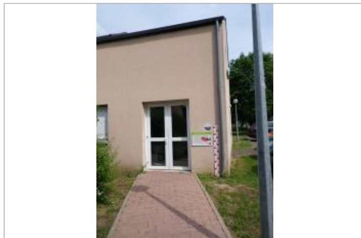
Vue du site en 2011, source : département du Loiret.

GÉOLOCALISATION Coordonnées WGS84 : X: 1.90539800 / Y: 47.88139800 Coordonnées RGF93 (Lambert 93) X: 618184.96 / Y: 6754011.95 Coordonnées RGF93 (ETRS89) : X: 1.905398 / Y: 47.881398 Code Hydro: ----0000 Rive de référence: Gauche