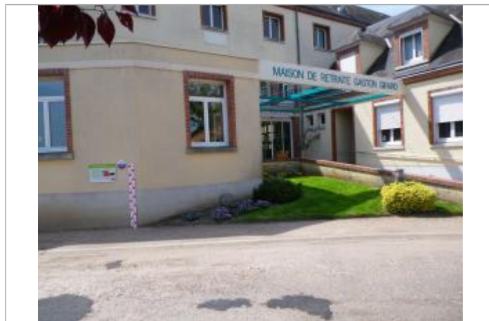
Vue du site en 2011, source : département du Loiret.

GÉOLOCALISATION Coordonnées WGS84 : X: 2.30642300 / Y: 47.81249600 Coordonnées RGF93 (Lambert 93) : X: 648090.98 / Y: 6746017.02 Coordonnées RGF93 (ETRS89) : X: 2.306423 / Y: 47.812496 Code Hydro : ----0000 Rive de référence: Droite