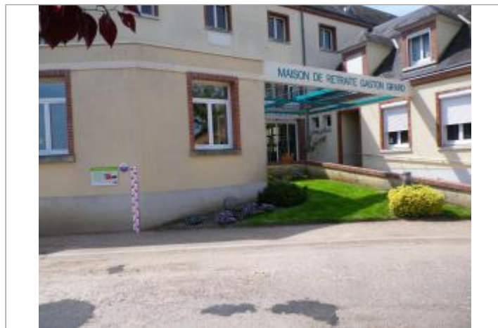
Vue du site en 2011.

GÉOLOCALISATION Coordonnées WGS84 : X: 2.30642300 / Y: 47.81249600 Coordonnées RGF93 (Lambert 93) : X: 648090.98 / Y: 6746017.02 Coordonnées RGF93 (ETRS89) : X: 2.306423 / Y: 47.812496 Code Hydro: ----0000 Rive de référence: Droite