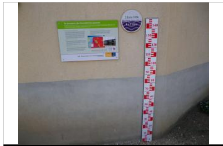
Vue du repère en 2011, source : département du Loiret.

MARQUE Texte : 2 juin 1856 - plus hautes eaux connues - La Loire Maximum de l'inondation : Oui Visibilité : Oui État du repère : Bon Pérennité : Longue Repère calculé : Non renseigné PHEC : Oui