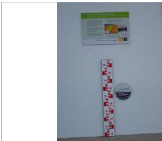
Vue du repère en 2011, source : département du Loiret.

Organisme : Conseil Départemental du Loiret SPC Loire-Allier-Cher-Indre