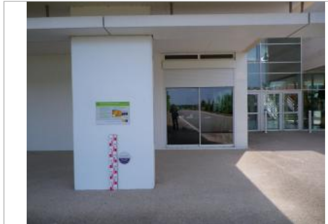
Vue du site en 2011.