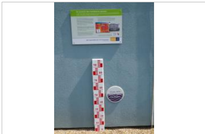
Vue du repère en 2011, source : département du Loiret.

Organisme(s) : Conseil Départemental du Loiret, SPC Loire-Allier-Cher-Indre