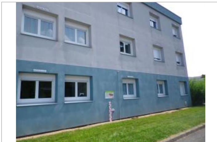
Vue du site en 2011, source : département du Loiret.