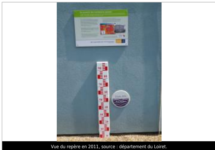
Vue du repère en 2011, source : département du Loiret.

Organisme(s) : Conseil Départemental du Loiret, SPC Loire-Allier-Cher-Indre