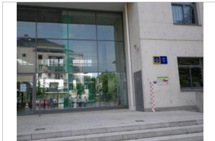
Vue du site en 2011

GÉOLOCALISATION Coordonnées WGS84 : X: 1.90672400 / Y: 47.88393100 Coordonnées RGF93 (Lambert 93) X: 618287.97 / Y: 6754292 Coordonnées RGF93 (ETRS89) : X: 1.906724 / Y: 47.883931 Code Hydro: ----0000 Rive de référence: Gauche