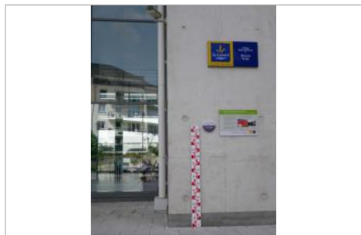
Vue du repère en 2011, source : département du Loiret.

MARQUE Texte : 2 juin 1856 - plus hautes eaux connues - La Loire Maximum de l'inondation : Oui Visibilité : Oui État du repère : Bon Pérennité : Longue Repère calculé : Non renseigné PHEC : Oui