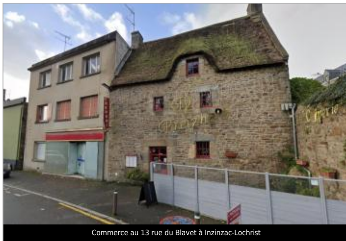
Commerce au 13 rue du Blavet à Inzinzac-Lochrist