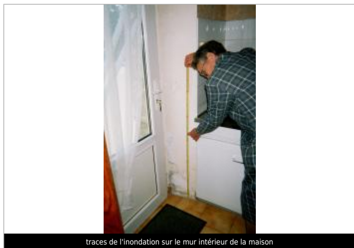
traces de l'inondation sur le mur intérieur de la maison

Différence entre le niveau d'eau et la référence (en m) : 0.650 m