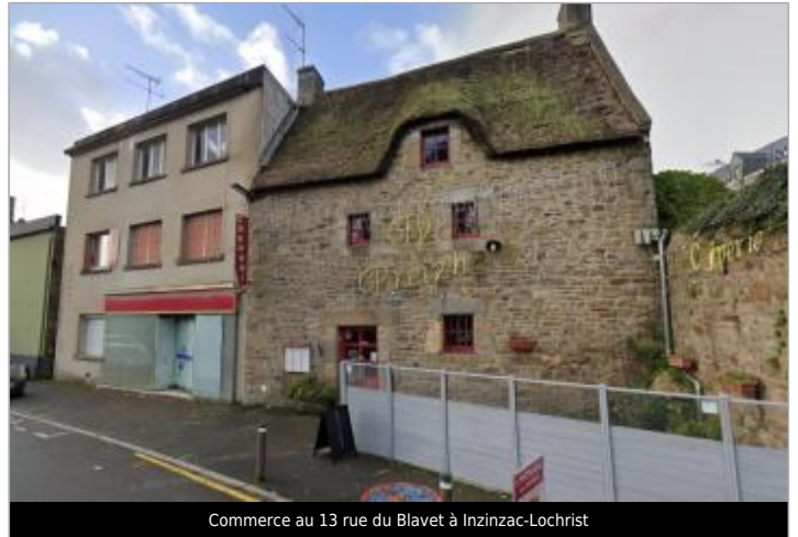
Commerce au 13 rue du Blavet à Inzinzac-Lochrist