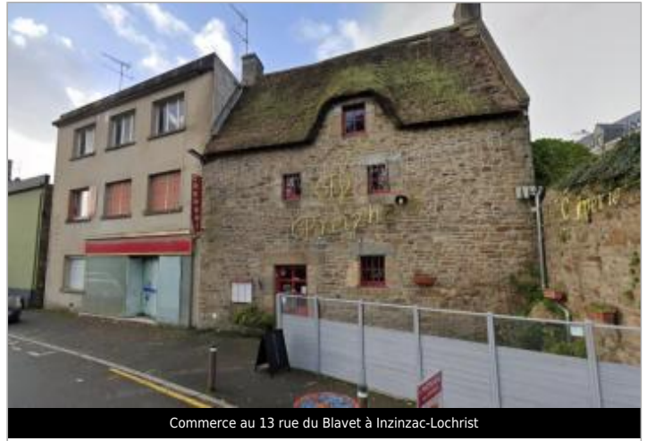
Commerce au 13 rue du Blavet à Inzinzac-Lochrist