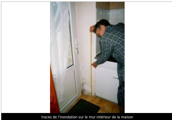
traces de l'inondation sur le mur intérieur de la maison

Différence entre le niveau d'eau et la référence (en m) : 0.650 m