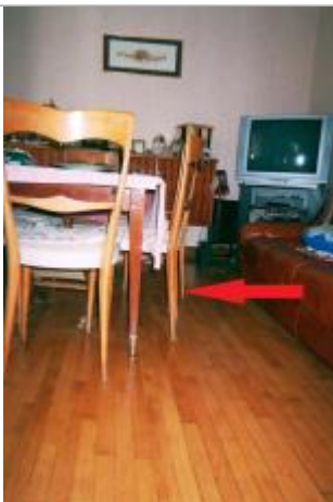
traces de l'inondation sur les meubles de l'habitation

Différence entre le niveau d'eau et la référence (en m) : 0.250 m