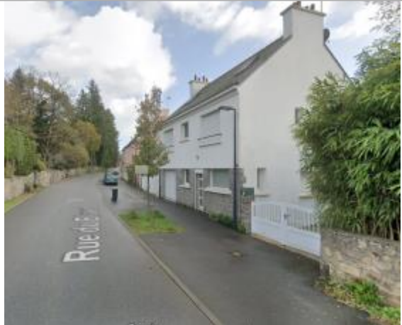
maison d'habitation au n°8 rue du Blavet à Inzinzac-Lochrist

Coordonnées WGS84 : X: -3.24672380 / Y: 47.82824280