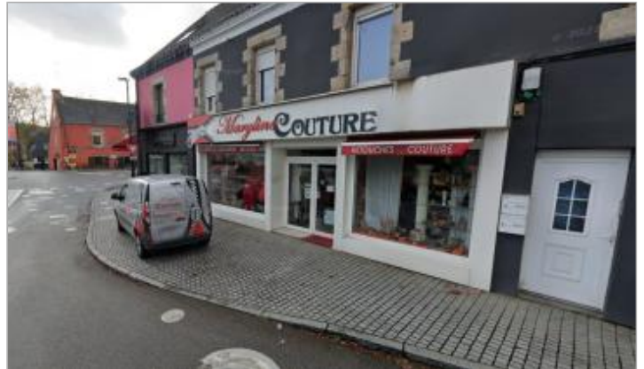
Ancienne maison d'habitation, aujourd'hui (2025) commerce au n°1 rue du Blavet