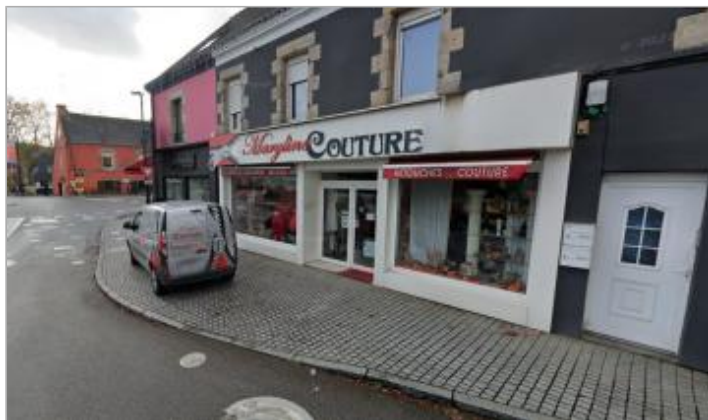
Ancienne maison d'habitation, aujourd'hui (2025) commerce au n°1 rue du Blavet

Coordonnées WGS84 : X: -3.24979212 / Y: 47.82701980