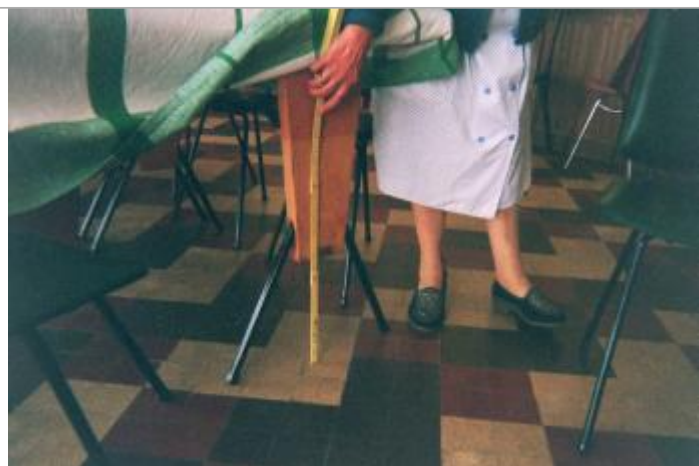
trace de l'inondation de janvier 2001 dans l'habitation

Différence entre le niveau d'eau et la référence (en m) : 0.500 m