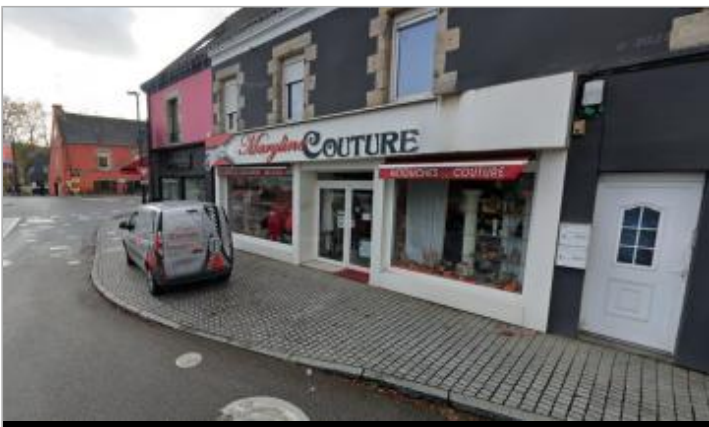
Ancienne maison d'habitation, aujourd'hui (2025) commerce au n°1 rue du Blavet

GÉOLOCALISATION Coordonnées WGS84 : X: -3.24979212 / Y: 47.82701980 Coordonnées RGF93 (Lambert 93) X: 232859.85 / Y: 6765899.25 Coordonnées RGF93 (ETRS89) : X: -3.2497921 / Y: 47.8270198 Code Hydro: J5--0210 Rive de référence: Droite