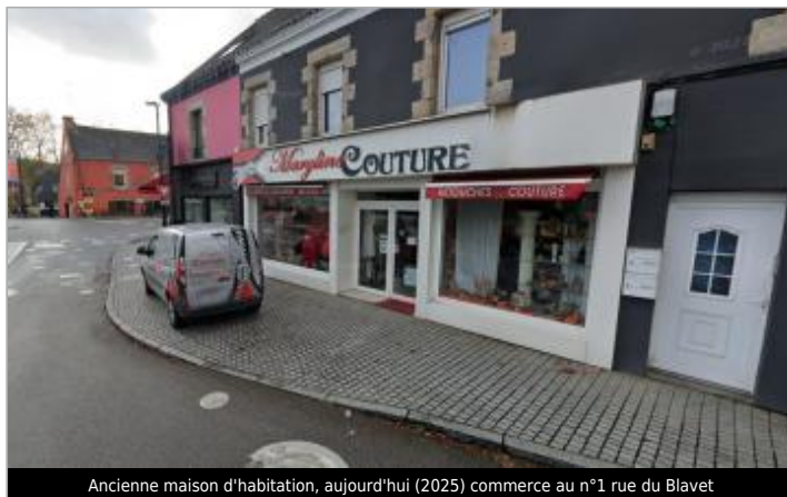
Ancienne maison d'habitation, aujourd'hui (2025) commerce au n°1 rue du Blavet

Coordonnées WGS84 : X: -3.24979212 / Y: 47.82701980