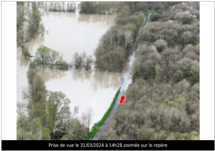
Prise de vue le 31/03/2024 à 14h28 zoomée sur le repère