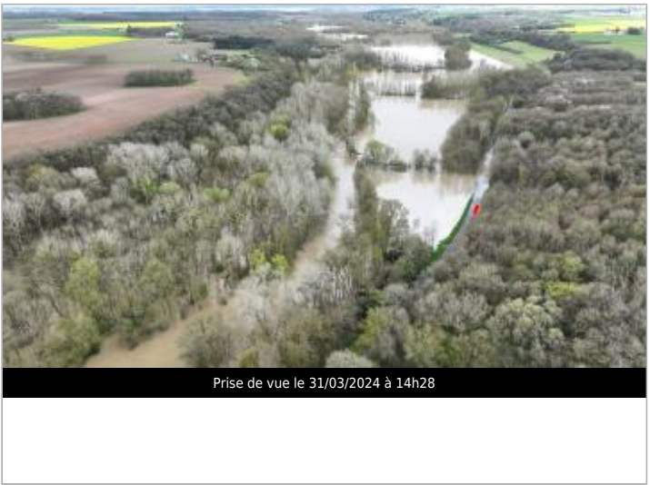
Prise de vue le 31/03/2024 à 14h28