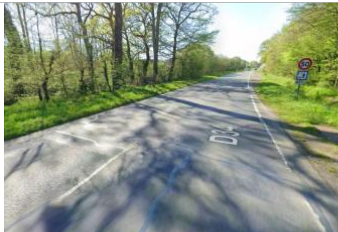
Chaussée de la RN34 à Mordelles

Coordonnées WGS84 : X: -1.82658920 / Y: 48.06872590