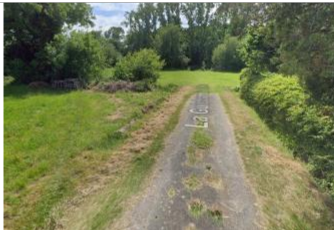
Chemin de la Guichardais à Mordelles

Coordonnées WGS84 : X: -1.82140339 / Y: 48.06590590