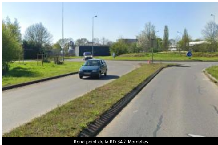
Rond point de la RD 34 à Mordelles

Coordonnées WGS84 : X: -1.83037527 / Y: 48.07007800