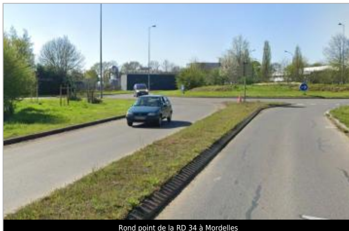
Rond point de la RD 34 à Mordelles