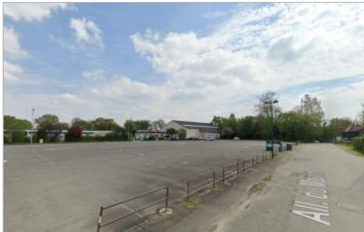
parking de la salle de sports Dordain

Coordonnées WGS84 : X: -1.84715336 / Y: 48.06937660