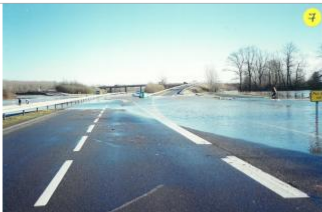
Inondation mars 2001 - RN 24 à Bréal-sous-Montfort et Mordelles

Altitude calculée de l'eau (en m) : 25.22 m