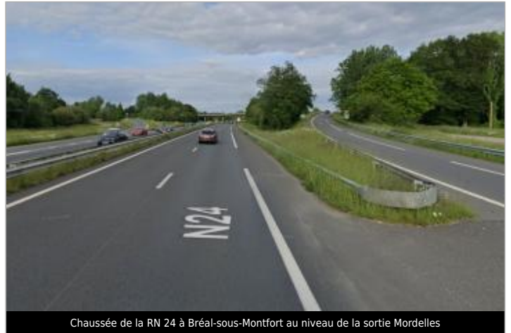
Chaussée de la RN 24 à Bréal-sous-Montfort au niveau de la sortie Mordelles

Coordonnées WGS84 : X: -1.85550881 / Y: 48.06596220