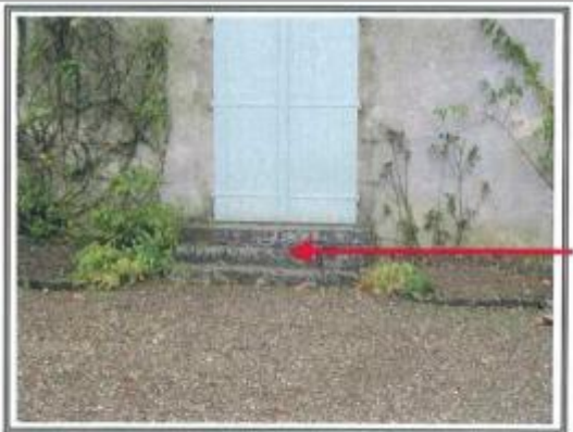
2 marches submergées.