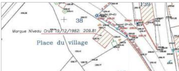
plan levé par un géomètre avant suppression du repère