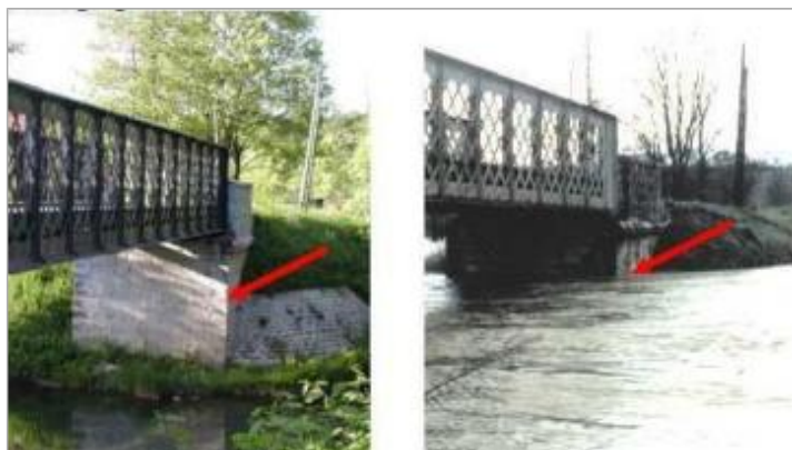
Photo du repère