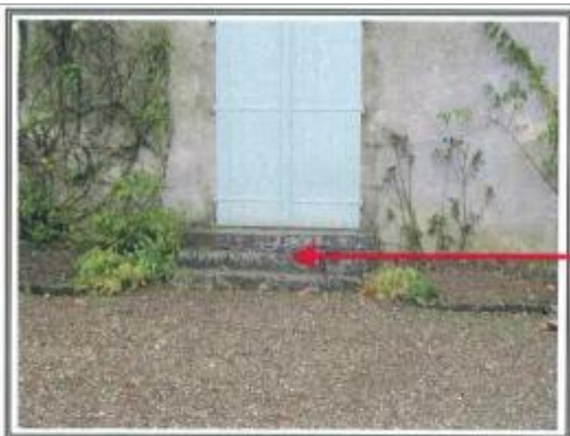
2 marches submergées.

Type de repérage : Source bibliographique Organisme(s) : DDT 25