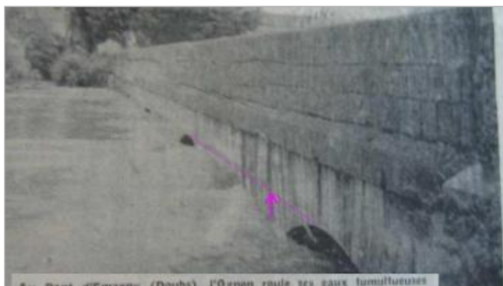
Au Pont d'Emagny (Doubs), l'Ognon roule ses eaux tumultueuses