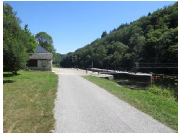
Amont de l'écluse de Trébihan à Languidic