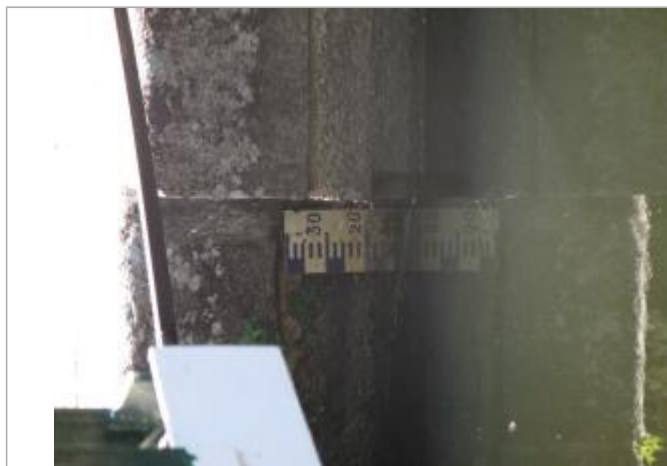
Echelle amont de l'écluse de Trébihan à Languidic

Altitude calculée de l'eau (en m) : 17.44 m