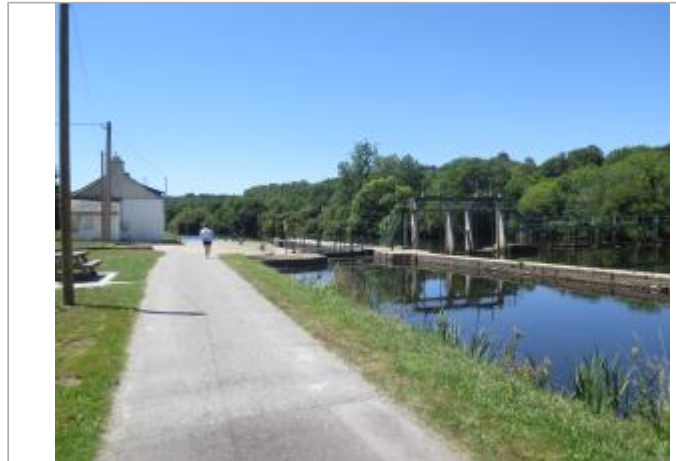
Amont de l'écluse de Rudet à Inzinzac-Lochrist

Coordonnées WGS84 : X: -3.20689166 / Y: 47.86128450