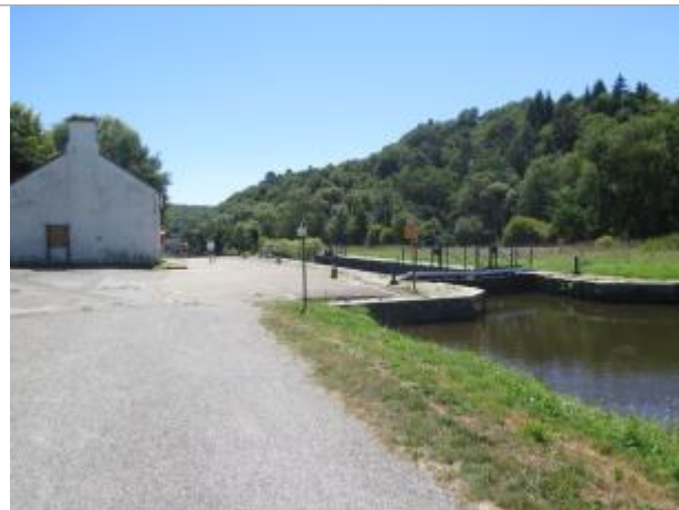
Amont de l'écluse de Manevern à Languidic