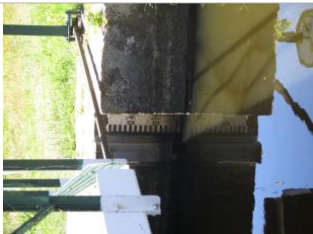
Echelle limnimétrique amont de l'écluse de Manevern à Languidic

Altitude calculée de l'eau (en m) : 21.16